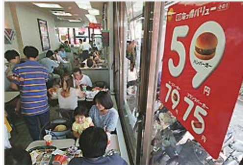
マクドナルドは10日からチーズバーガーなどを値上げする

同社の1月の既存店売上高は前年同月比5～10%程度減ったもようで、前年実績割れは16カ月連続。前12月期決算で29年ぶりに最終赤字に転じた同社は、年末までに不採算の176店を閉鎖する方針。価格の見直しで営業面でも、てこ入れするが、消費者の支持が得られるかどうかは不透明だ。