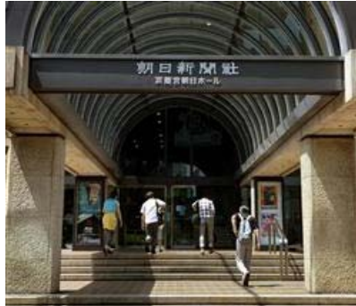
立派な社屋から誤報を発信した朝日新聞社【拡大】

慰安婦問題だけではない。いわゆる「南京大虐殺」も、歴史の事実としては存在しなかった。それなのに、なぜ「南京大虐殺」という表現が、刷り込みのように報道で使われるのか。南京大虐殺という表現を、報道で使うべきではない。