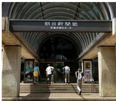
立派な社屋から誤報を発信した朝日新聞社【拡大】

今回の件は、単なる誤報ではない。英国人ジャーナリストとして、一連の経過を観察してきた私としては、朝日新聞の慰安婦をめぐる恣意的報道は極めて問題である。その背景を検証する必要がある。