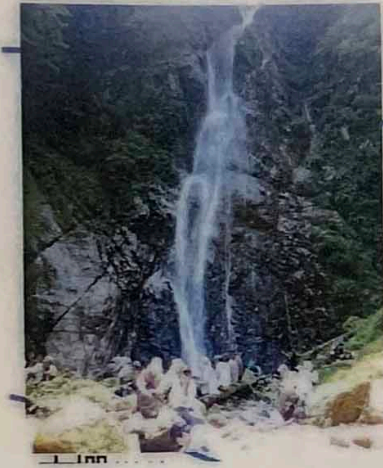
本棚 落差約60m 標高803m