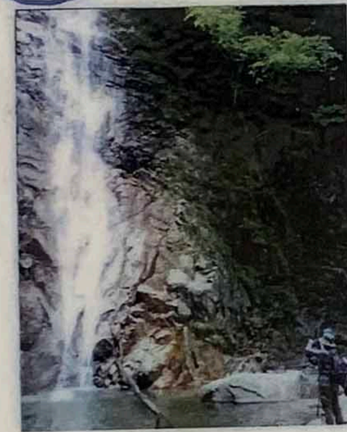
下棚 落差約40m 標高758m