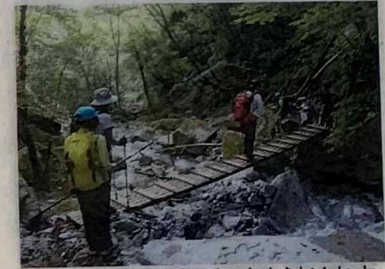
木の橋を何度も渡ります