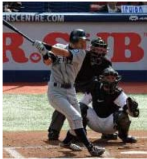
ブルージェイズ戦で今季通算200安打を達成したイチロー

<ブルージェイズ1-0マリナーズ>◇23日(日本時間24日)◇ロジャーズセンター